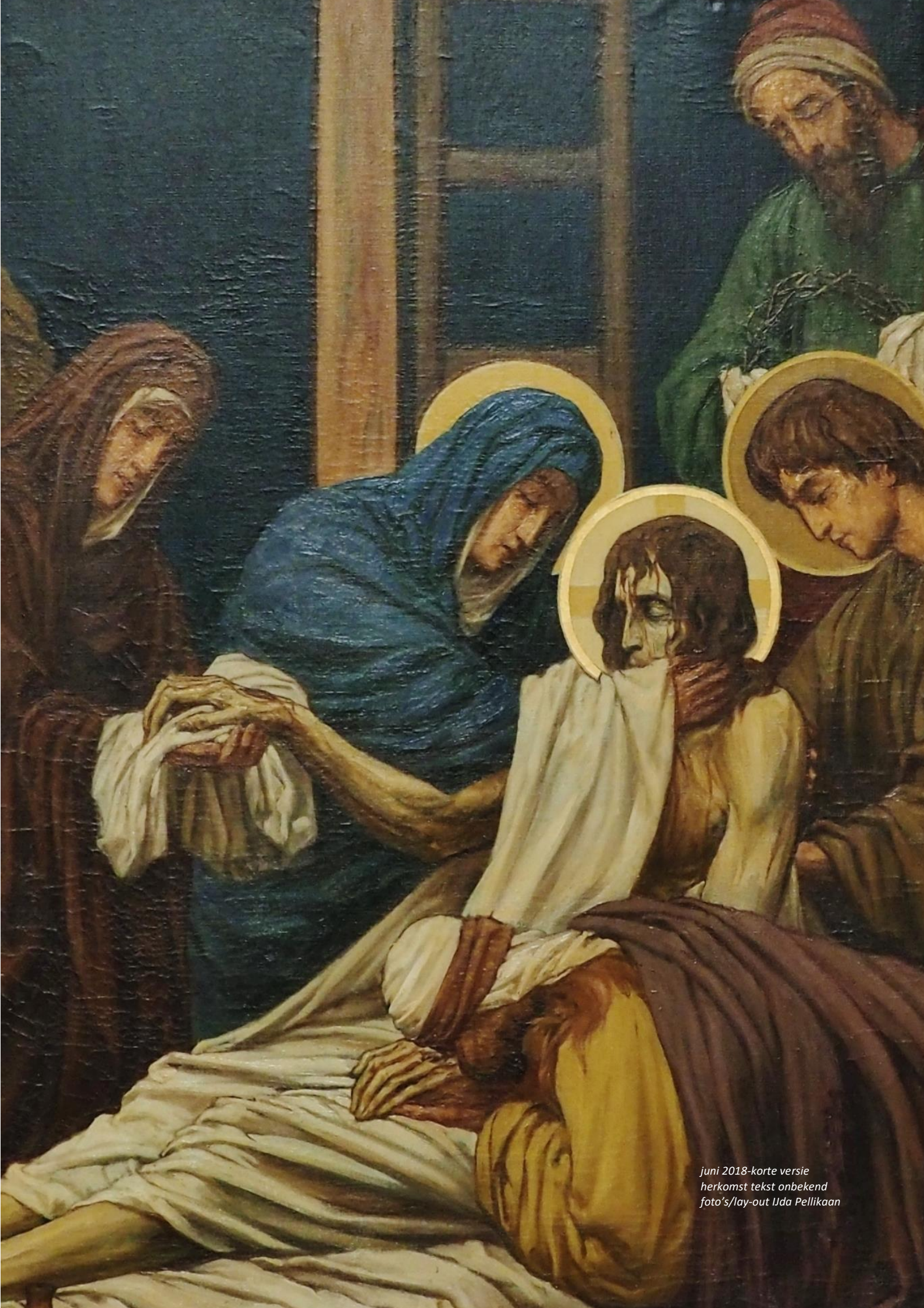
juni 2018-korte versie herkomst tekst onbekend foto's/lay-out Iida Pellikaan