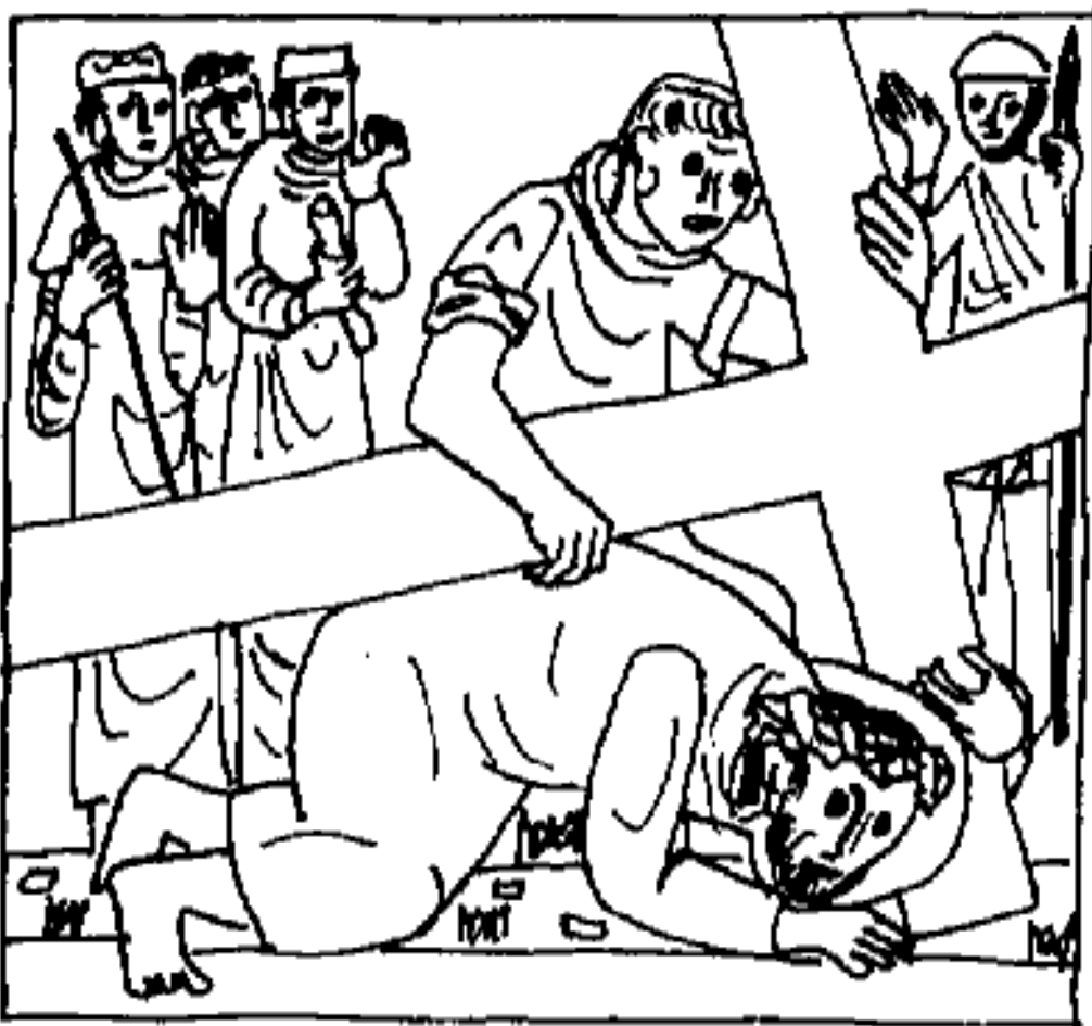
De negende statie: Jezus valt voor de derde maal

God, mag ik mensen helpen opstaan, die gevallen zijn.