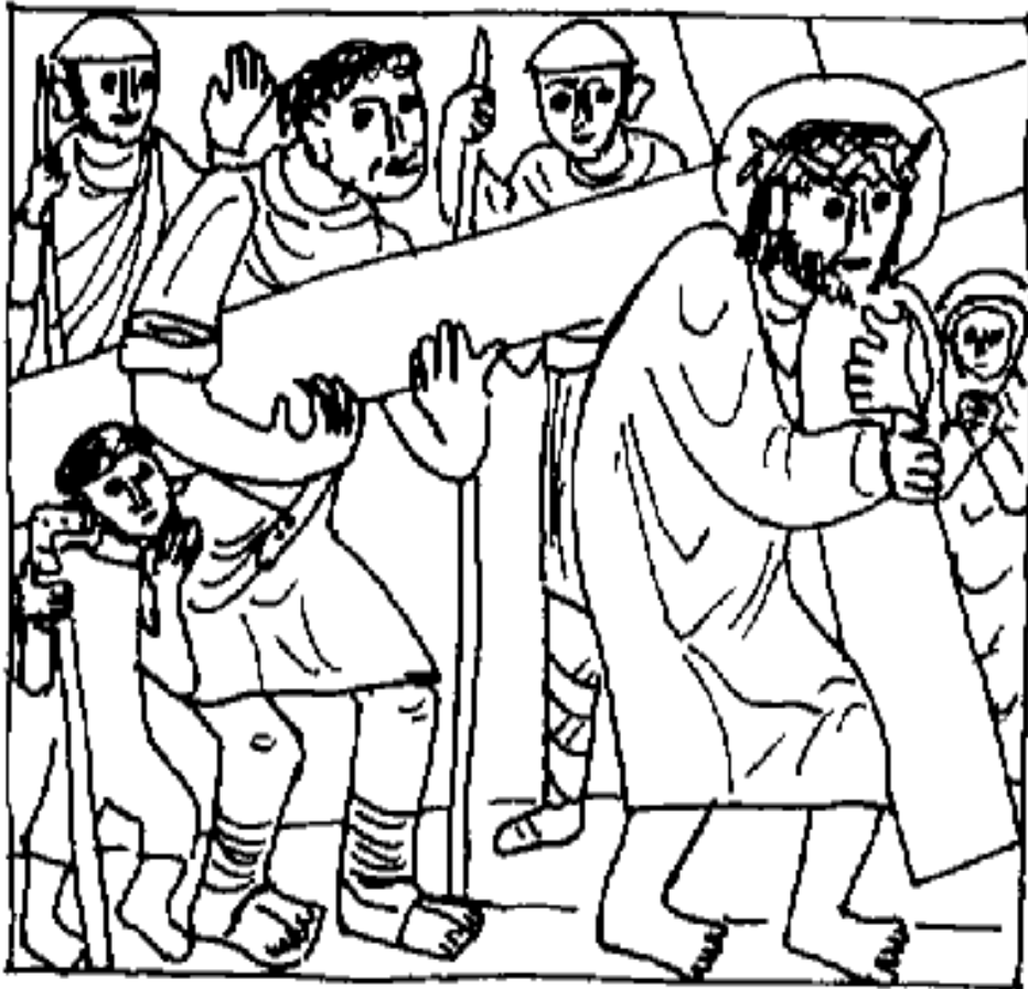
De vijfde statie: Simon van Cyrene helpt Jezus zijn kruis te dragen

God, mogen wij elkaar helpen, als een ander het moeilijk heeft.