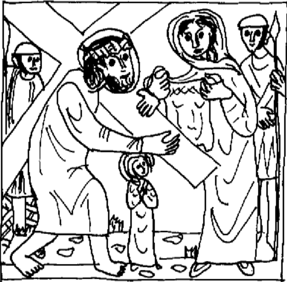
De zesde statie: Veronica droogt het (aan)gezicht van Jezus af

God, mogen wij elkaar troosten, als we verdrietig zijn.