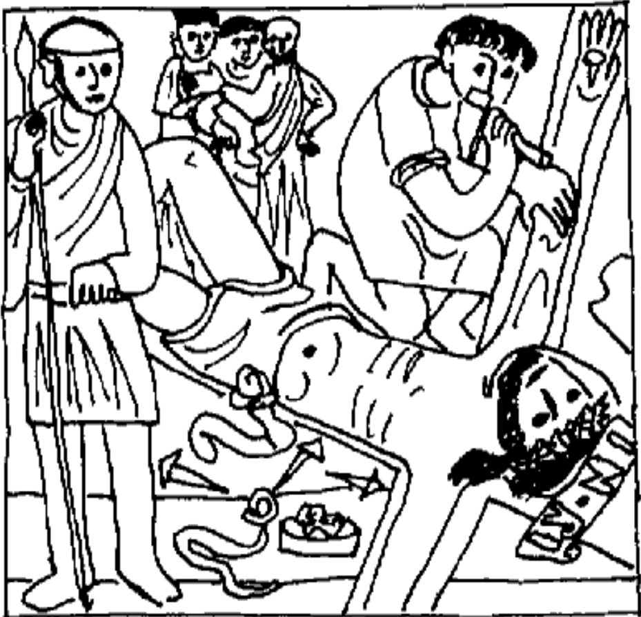
De elfde statie: Jezus wordt aan het kruis genageld

God, laten wij andere mensen nooit slaan of pijn doen.