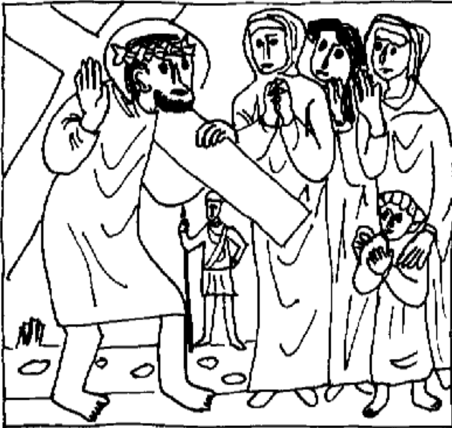
De achtste statie: Jezus troost de wenende vrouwen

God, laat mij eerst denken aan anderen, dan pas aan mezelf.